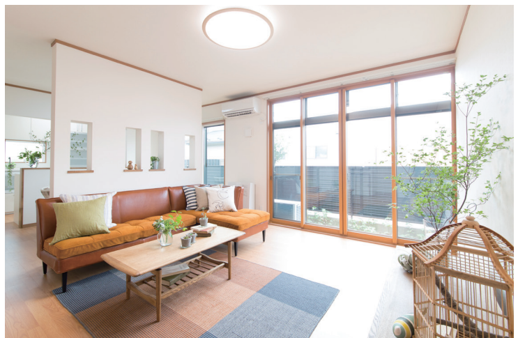
写真はイメージです。弊社施工事例。