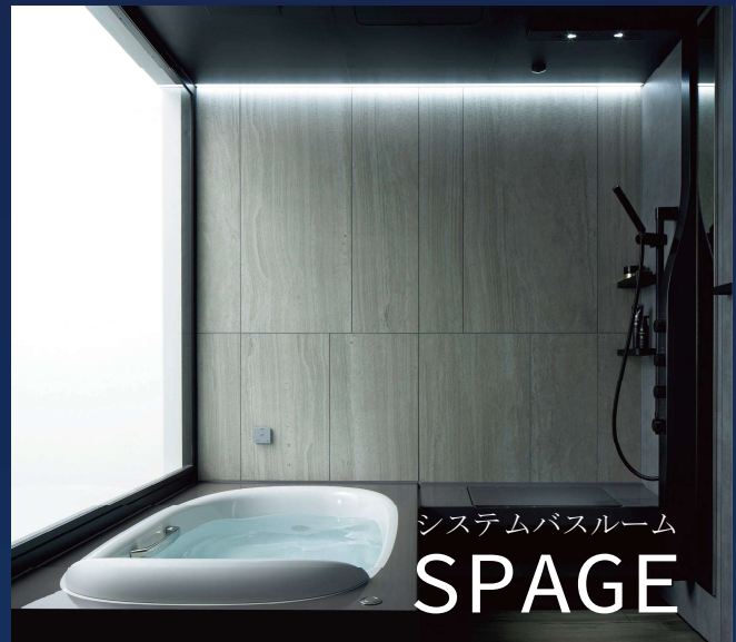
システムバスルーム SPAGE