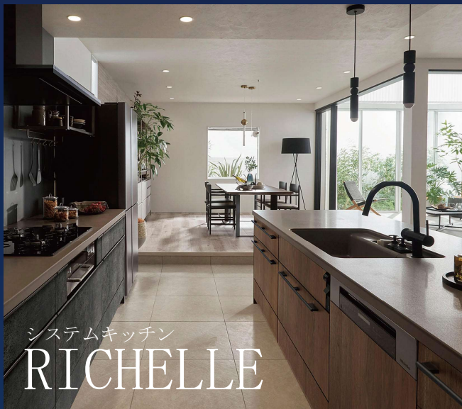
システムキッチン RICHELLE