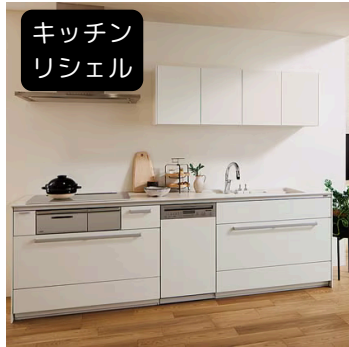
キッチン リシェル