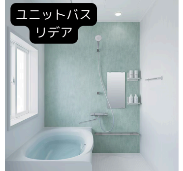
ユニットバス リデア