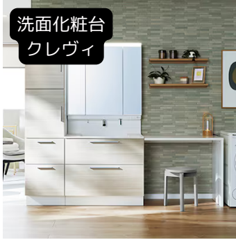
洗面化粧台 クレヴィ