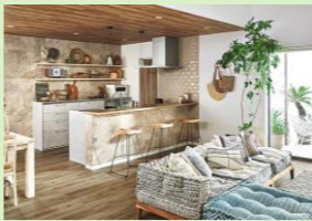
▲キッチン対面化など