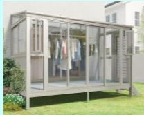
▲雨の日の洗濯物干しに!花粉対策にも。