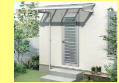
▲勝手口などの雨除けなど