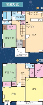
※間取り状況が異なる場合は販売先を優先します。