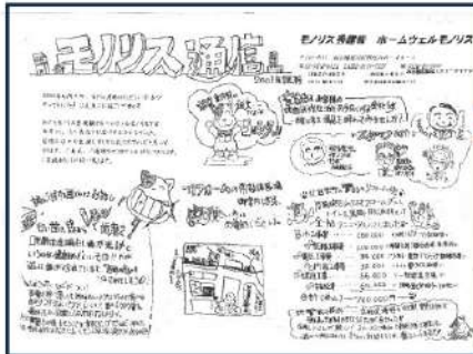
2001年12月 モノリス通信第1号発行！