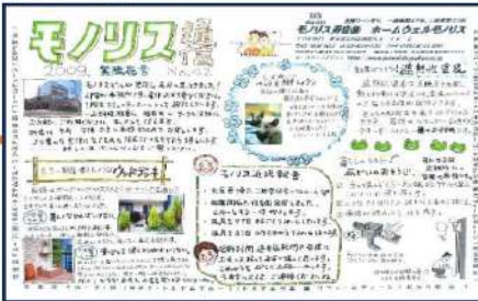
2009年第42・紫陽花号 第1回モノリスお客様感謝祭開催！