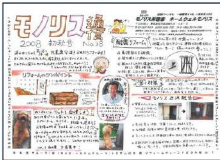
2008年第38・初秋号 モノリス通信がカラーになりました