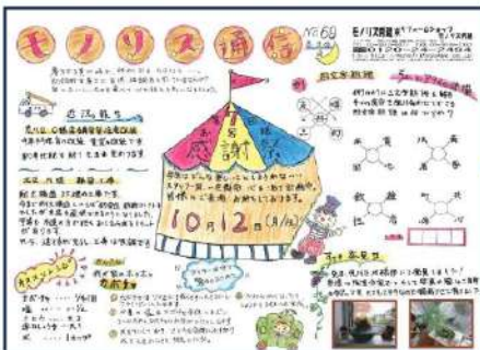
2016年モノリス通信第69号 モノリスお客様感謝祭は、2009年より開催しています。