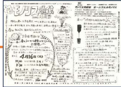
2006年第28号 ショールームバスツアー にお客様を招待しております