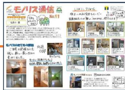
2021年第91号 QRコードで様々な情報をお届けできるようになりました。